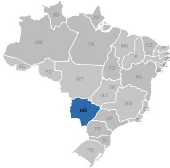
Figura 5- Mato Grosso do Sul