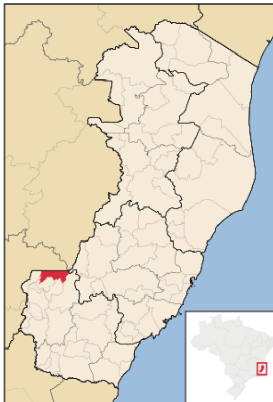
Figura 4- Ibatiba- ES