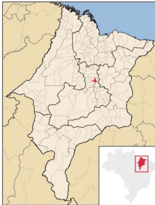
Figura 2- Pedreiras- Maranhão