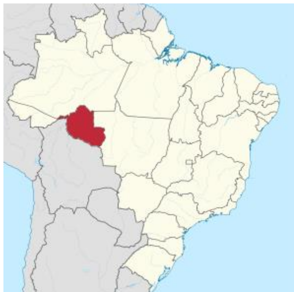
Figura 1- Rondônia- Ariquemes