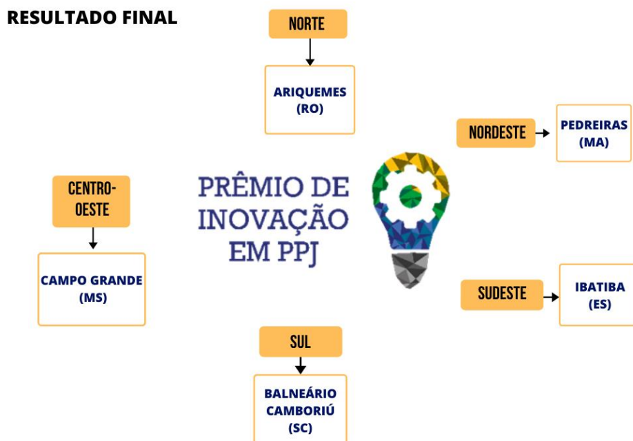
Figura 1- CINCO INICIATIVAS INOVADORAS

O Prêmio de Inovação em Políticas Públicas de Juventude é uma iniciativa do Ministério da Mulher, da Família e dos Direitos Humanos - MMFDH, por intermédio da Secretaria Nacional da Juventude - SNJ, cujo objetivo é premiar experiências exitosas na implementação de inovações em políticas públicas voltadas para a juventude nos municípios brasileiros.